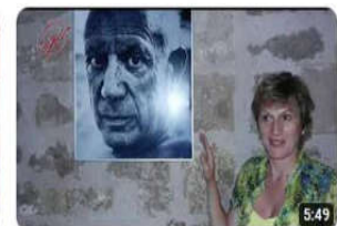
Studienreise Barcelona Gedankensplitter 178 Aufrufe • vor 3 Jahren