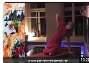
JAHrgang Eine Performance zum Tanz durchs Jahr 4 Aufrufe • vor 3 Jahren