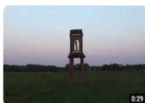
Lowentor Gastmahl der Engel