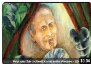
Gabriele Watterott Malerei und Collage 41 Aufrufe • vor 3 Jahren